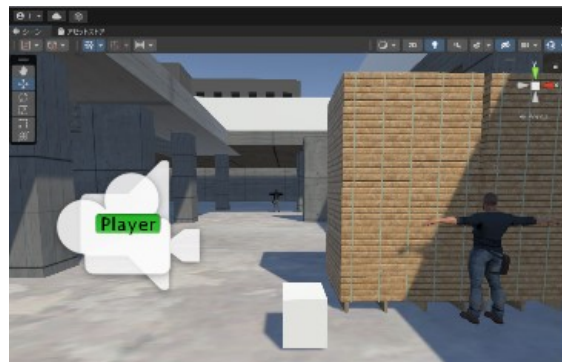
図 1 VR 建設現場シミュレータの画面

実写動画は建設業者の協力のもと撮影し、その業務の妨げにならないよう撮影する必要があったため、技能労働者の詳細な作業のほか、安全上の制限で危険箇所や事故現場を撮影することができなかった。そこで、3D ゲームエンジン（Unity）を用いて仮想建設現場をプログラミングし、HMD（Head Mount Display）とコントローラを用いて細かな現場作業や労働災害の仮想体験などができるように構築し、現場の臨場感を付与した（図 1）。