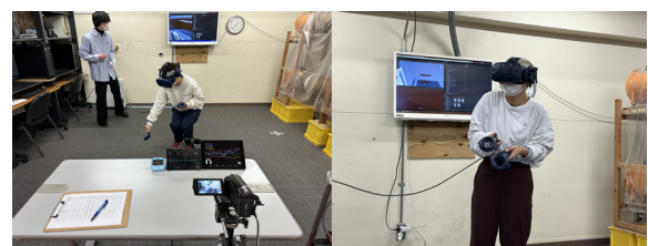
図 4 VR 体験の様子