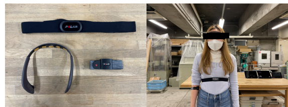
図 2 生体情報デバイスおよび装着の様子